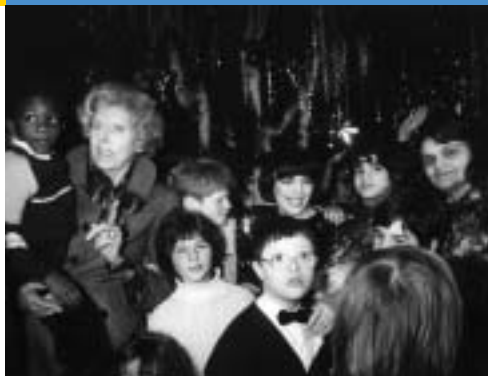
L'arbre de Noël

J'ai toujours eu des activités sociales. Je les ai apprises de ma famille, où l'on nous conseillait de ne pas nous enfermer entre nous mais de nous ouvrir aux autres, de les accueillir, de les aider.