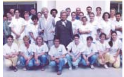
Avec le personnel d'un établissement.

Dans toute cette entreprise, l'aspect le plus intéressant à mes yeux est le bénévolat. Ce fut le pari de départ, devenu une nécessité pour répondre au besoin crucial de solidarité de notre société, et j'aimerais en parler. Les bénévoles de ma Fondation sont issus de tous les milieux sociaux, des plus modestes aux plus favorisés [...] J'ai toujours beaucoup de plaisir à les rencontrer et à les remercier de leur dévouement, de la simplicité avec laquelle ils le prodiguent, n'ayant pour but que la réussite de leur action. Mais ils décli-