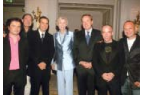
Avec les artistes

les comptes –j'en serais au demeurant incapable- mais je suis tout de très près et me fais tout expliquer en détail [...]