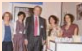
Le Président du Congrès sur le stand de la Fondation.

La Fondation Claude Pompidou était présente à la 103 e édition du Congrès des Notaires à Lyon du 23 au 26 septembre dernier. A cette occasion, la Fondation