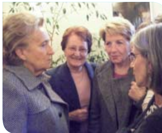
Avec les responsables bénévoles.

Ils étaient 50 responsables d'équipe de bénévoles parisiens et régionaux à se réunir le 24 octobre dernier autour de Bernadette Chirac , leur nouvelle présidente. Cette rencontre a été l'occasion pour chacun d'entre eux de faire connaître leurs actions auprès des personnes handicapées à domicile et dans les services hospitaliers auprès des malades et des personnes âgées. Bernadette Chirac, leur exprima, quant à elle, sa