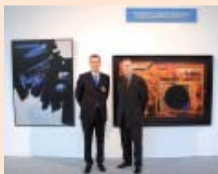
Le stand de la Fondation à la FIAC.

Nombreux sont les artistes qui ont bien voulu mettre leur talent au service des causes défendues par Claude Pompidou en particulier dans le combat contre