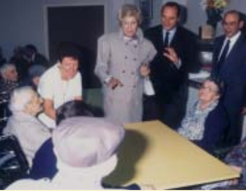
Avec les résidents

apportent une écoute attentive et amicale à leurs propos, sans faire aucun acte médical ou paramédical. On ne peut imaginer l'importance du support psychologique de cette écoute du patient. C'est ainsi que fut créé le premier service de volontariat à l'hôpital de la Fondation.