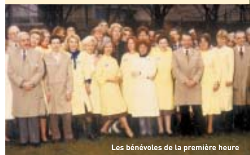
Les bénévoles de la première heure

En parallèle à la construction d'établissements spécialisés, j'eus l'idée du bénévolat à laquelle je suis attachée, convaincue que ce sera, dans les années à venir, une véritable priorité. Je décidai de l'ériger en institution dans deux domaines : l'hôpital et les familles d'enfants handicapés. A l'hôpital, de tout temps il y eut des visiteurs volontaires, mais il s'agissait plutôt d'actions ponctuelles. Moi, je voulais constituer un service régulier, qui existe désormais. Il fallut trouver à ces bénévoles une tenue spéciale afin de les distinguer du personnel soignant. Ce fut une blouse jaune. « Les blouses jaunes », c'est ainsi qu'on les appelle, visitent les malades qui souhaitent parler avec quelqu'un,