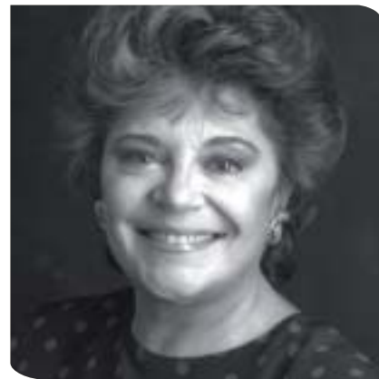
Madame Philippine de Rothschild.

Comme elle l'avait déjà fait en 2002, l'occasion d'une vente chez Sotheby's (New York) à la fin du mois de février lui permet d'agir : elle met aux enchères des bouteilles prestigieuses ; des magnums et des jero-boams dont la vente rapportera à la Fondation la somme de 50 000 dollars. Une initiative spontanée bien à l'image de cette grande dame enthousiaste, généreuse et attentive aux autres. Qu'elle en soit vivement remerciée ici. ■