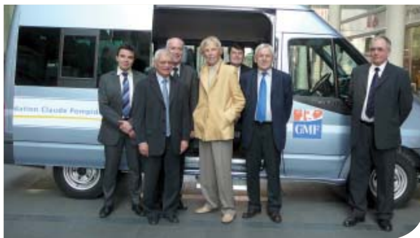
les membres du bureau GMF Solidarité et le directeur de Vinci Park avec Madame Georges Pompidou.