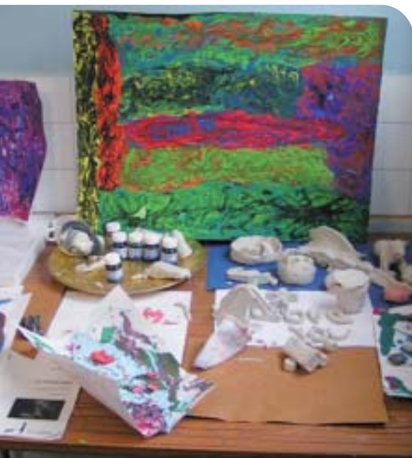
L'atelier d'art thérapie de Treignac.

L'art thérapie a fait ses preuves au Centre des Monédières à Treignac, une Maison d'Enfants à Caractère Social.