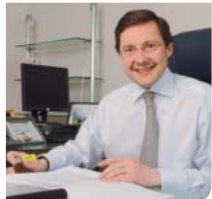
Philippe Bas, ministre délégué à la Sécurité sociale, aux Personnes âgées, aux Personnes handicapées et à la Famille.

Philippe Bas : Ce dispositif tente d'éviter les phases de ruptures qui riment encore trop souvent avec