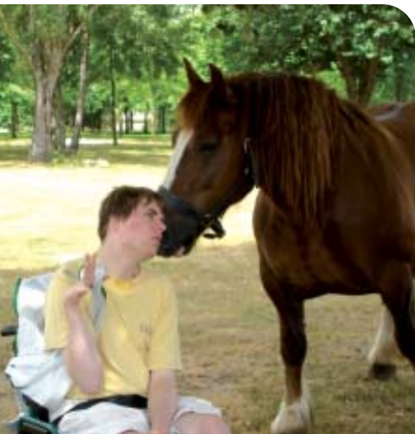
Équithérapie au Centre Kerdreineg.

Etablissement d'avant-garde à son ouverture en 1986, Kerdreineg est un Institut Médico Educatif situé dans le Morbihan, pour des adolescents polyhandicapés ou présentant des troubles du comportement et des conduites, qui a su préserver son dynamisme.