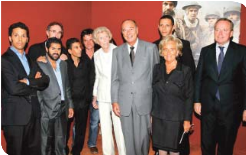
Madame Claude Pompidou, entourée du Président de la République et de son épouse, du Ministre de la Culture ainsi que de l'équipe du film Indigènes .

Le gala annuel de la Fondation Claude Pompidou s'est déroulé le 5 septembre dernier. Cette manifestation a permis à la Fondation de recueillir près de 300 000 euros !